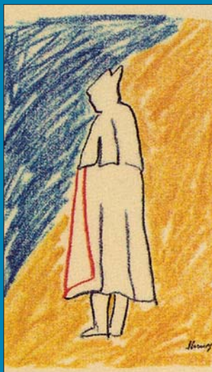
Orden del Sabadiego.

Termina el citado texto con el siguiente consejo: "Si a Santiago haces Camino, y es largo tu caminar, no lo dudes peregrino: Por Noreña el mejor peregrinar" Tristan Calैया.